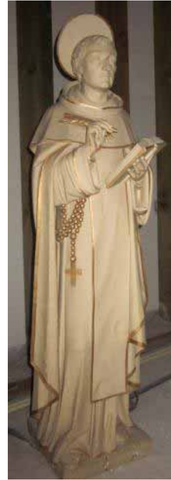
Heilige Dominicus, driemaal anders